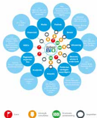
HollandBIO: spin het web van de biotech sector